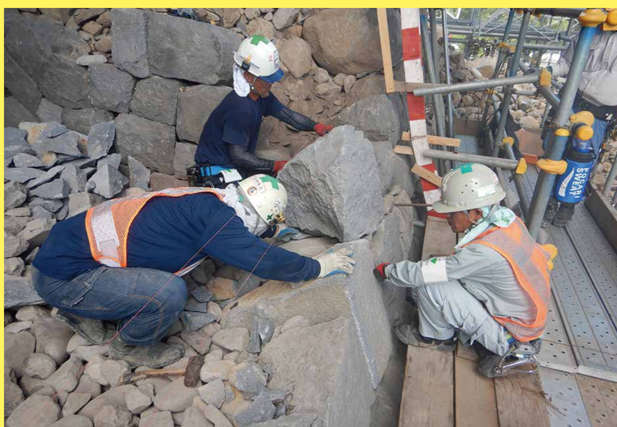
4 大天守石垣積み直しの様子