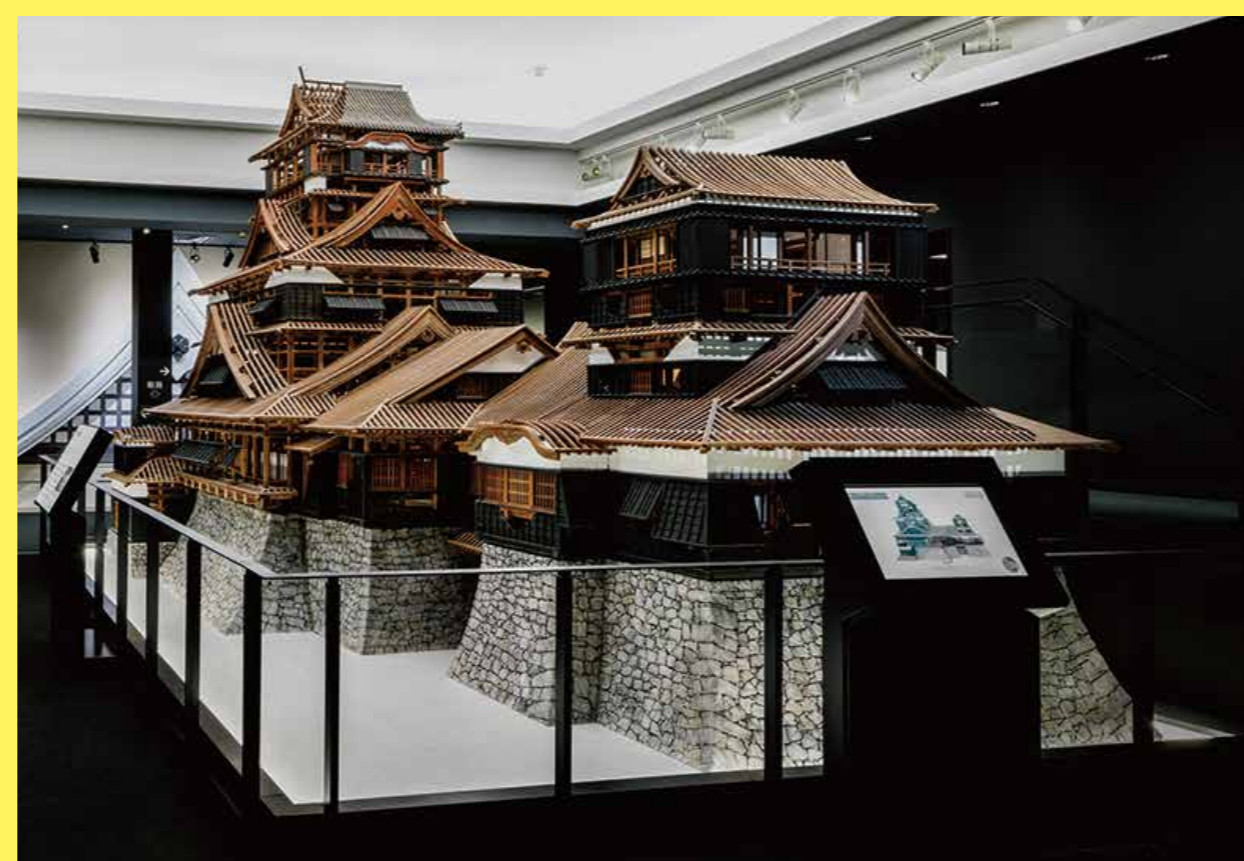
天守閣内部の展示