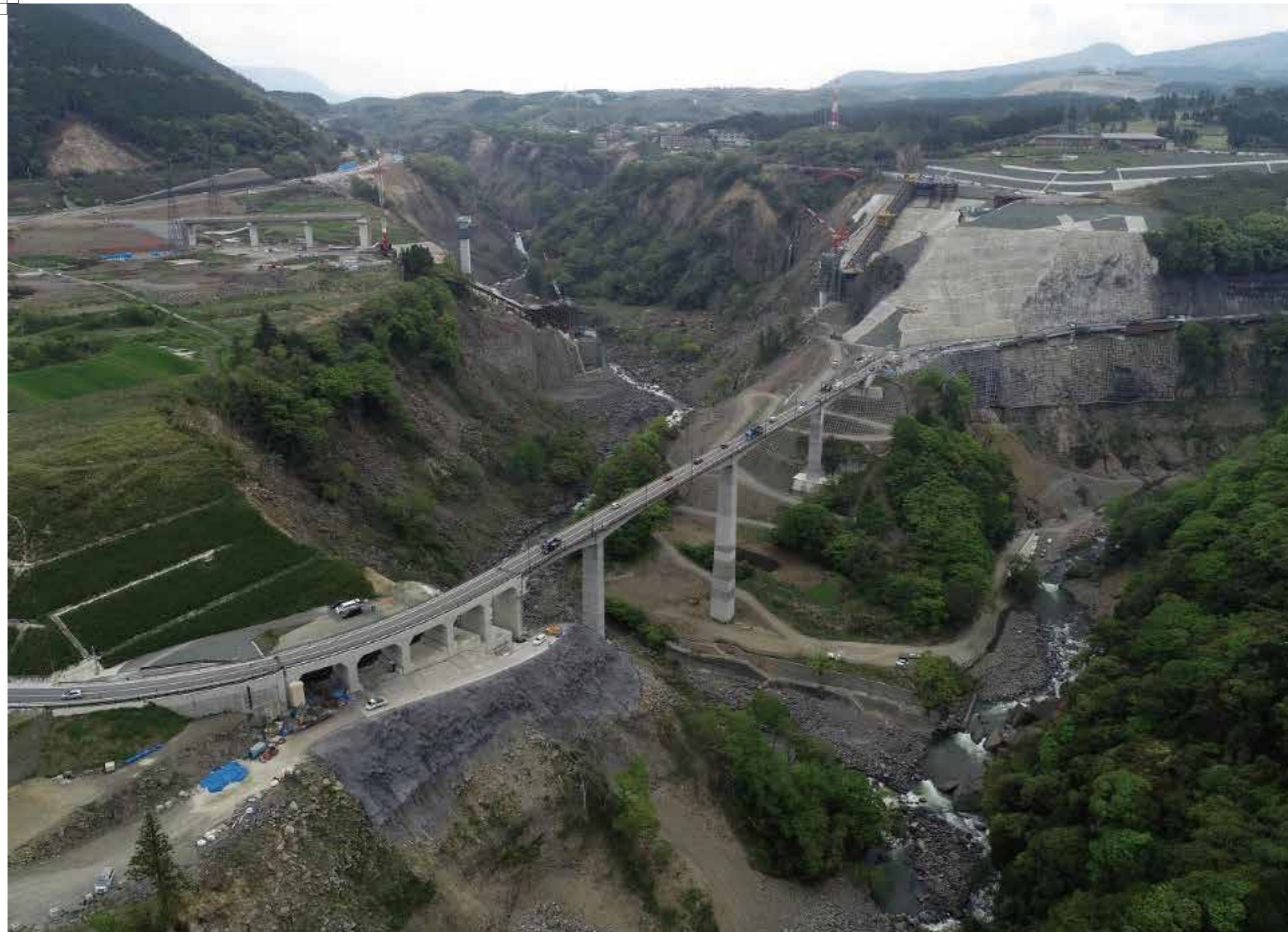
長陽大橋及び新阿蘇大橋(工事中)