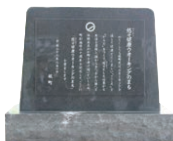
「悠悠健康ウォーキングのまち」宣言の記念碑