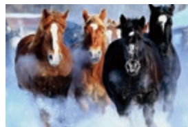
開拓を支えた農耕馬

十勝の開拓は、明治16(1883)年に静岡県をはじめとして、富山、岐阜など本州からの民間の開拓移民により進められました。以来130年余り、十勝は寒冷な気象条件にありながらも、恵まれた土地資源を活かし、近代技術の導入や土地基盤整備を進めながら、農業を主要産業として栄えてきました。