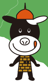
とかちの魅力PR大使 サイロウシ