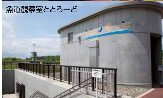
魚道観察室ととろーど