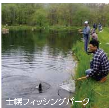
士幌フィッシングパーク