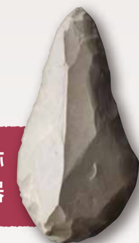
大平山元遺跡 搔削器