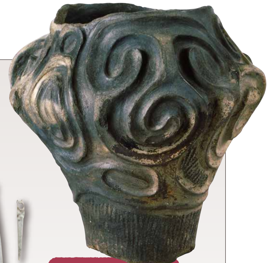
是川石器時代遺跡 縄文時代中期の土器