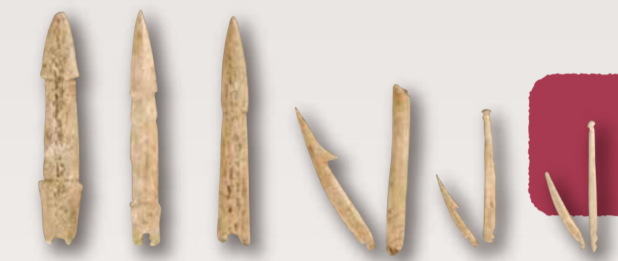
長七谷地貝塚 骨角製漁労具

遠くから安全に獲物をしとめることができる弓矢が使われ、魚介を獲るための釣り針、銚などの漁労具の開発も進みました。 人々は、丸木舟を巧みに操り、遠方との交流や交易も行われ、ヒスイやアスファルト、黒曜石が運ばれました。装身具類も発達し、豊かな精神世界を持っていたことがわかります。