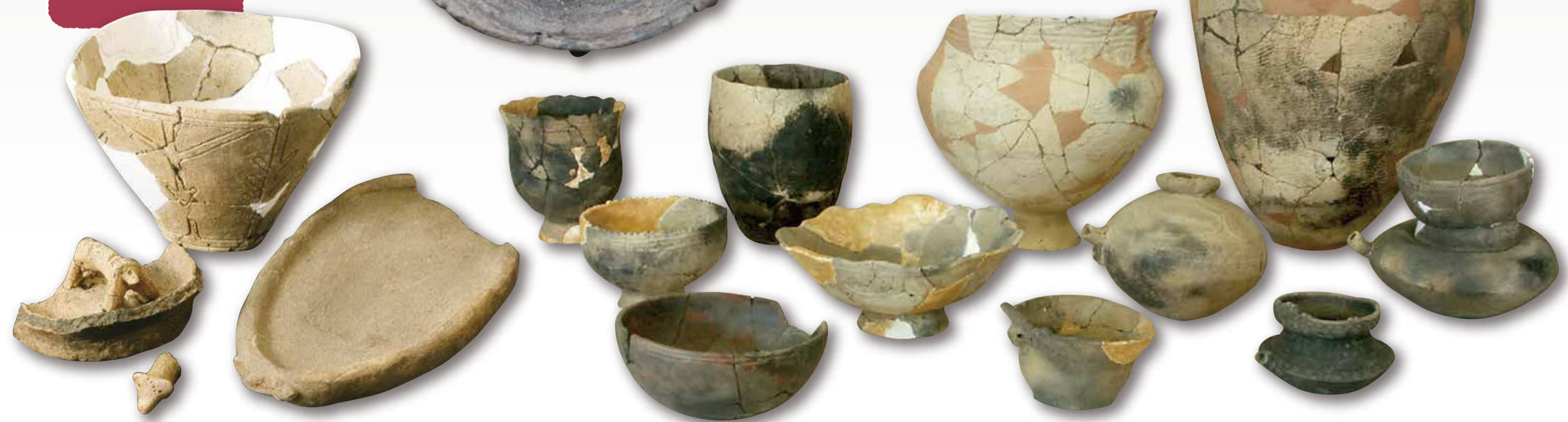
小牧野遺跡 動物関連遺物

遠くから安全に獲物をしとめることができる弓矢が使われ、魚介を獲るための釣り針、銚などの漁労具の開発も進みました。 人々は、丸木舟を巧みに操り、遠方との交流や交易も行われ、ヒスイやアスファルト、黒曜石が運ばれました。装身具類も発達し、豊かな精神世界を持っていたことがわかります。