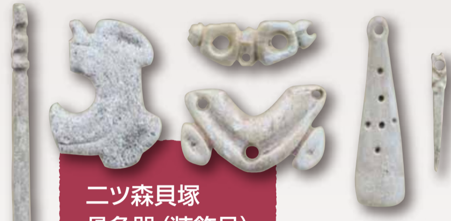
二ツ森貝塚 骨角器 (装飾品)