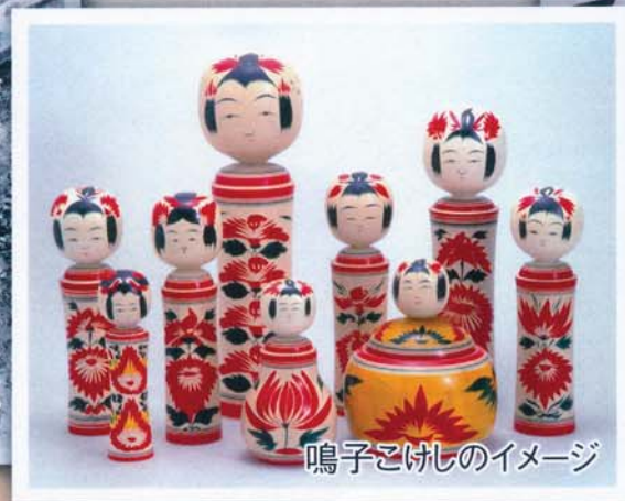
鳴子こけしのイメージ