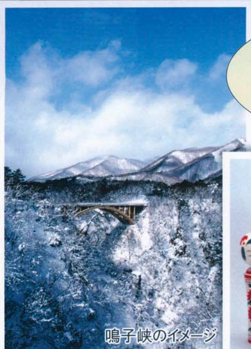
鳴子峡のイメージ