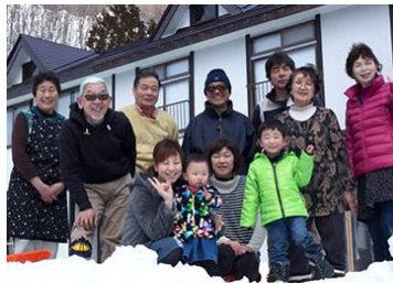
農家民宿で雪国の生活体験