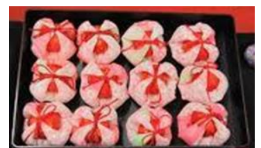
吊るし雛作り体験