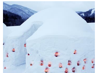
かまくらで麦ぶた鍋