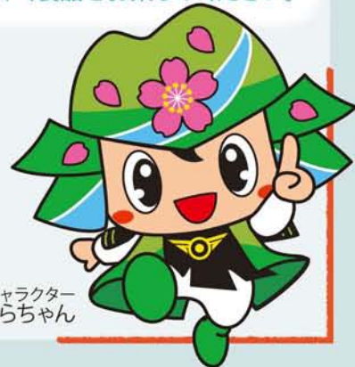
甘楽町キャラクター かんらちゃん

北区と甘楽町との友好の歴史と絆を ふりかえり、北区の自然休暇村「甘楽 ふるさと館」の魅力などを紹介します。