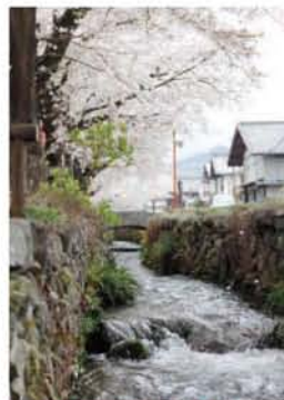
小幡地区の雄川堰と桜並木

スポーツ・レクリエーションなどを通じ、都会にはない豊かな自然を味わっていただくことを目的に、甘楽町と北区の間で、宿泊機能を備えた「甘楽ふるさと館」を拠点として、交流を図っています。