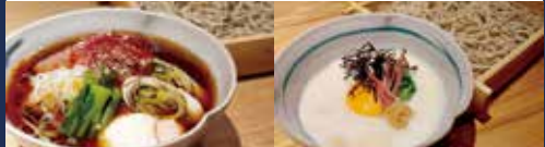
十勝産ナイタイ和牛と温玉のつけ蕎麦 使用食材: ナイタイ和牛・たまご

住所: 墨田区向島 5-27-10 Sビル TEL: 03-6658-8462 営業時間: 昼 11:30~14:00 / 夜 17:00~23:00 定休日: なし ジャンル: そば、和食(その他)、懐石・会席料理