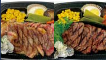
テイクアウトのみにて販売 和牛リブロースステーキ(北海道産別産)

住所: 墨田区八広 3-7-1 TEL: 03-5631-2539 営業時間: 昼 11:30~14:00 ※緊急事態宣言に伴い営業時間、定休日を変更させていただいております。詳しくはTELでご確認をお願いいたします。 ジャンル: すき焼き・しゃぶしゃぶ