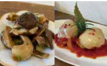
原木しいたけのトリフォラーティ 使用食材: 原木しいたけ

住所: 墨田区東向島 2-29-1 TEL: 03-6657-1668 営業時間: 月~土 10:00~19:30 (L.O. 19:00) 日曜日 11:00~17:00 (L.O. 16:30) 定休日: 第一・第三月曜日、祝日 ジャンル: 和食・洋食