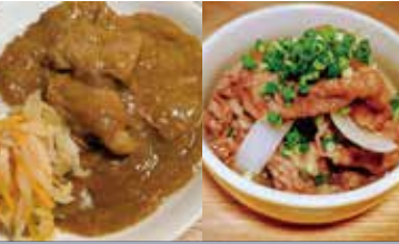
うらほろ和牛のビーフカレー 使用食材: 牛肉(うらほろ和牛)

住所: 墨田区東向島 6-2-3 TEL: 03-6886-5434 営業時間: ランチ 11:00~14:00 夜 16:00~20:00 定休日: 水曜日 ジャンル: 弁当、総菜販売