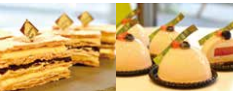
ハスカップとキタノカオリのミルフィーユ 使用食材: ハスカップ・小麦粉(きたのかおり)・牛乳・生クリーム

住所: 墨田区緑 2-14-14 TEL: 03-3631-6630 営業時間: 10:00~20:00 定休日: 木曜日 ジャンル: 洋菓子