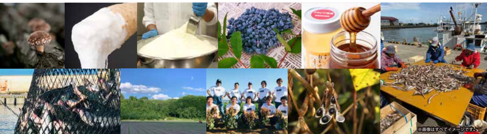
※画像はすべてイメージです。

9月30日(木) ~10月12日(火) 【墨田区は、10月2日(土)・9日(土)】