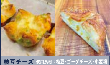
枝豆チーズ 使用食材: 枝豆・ゴーダチーズ・小麦粉

住所: 墨田区向島 3-39-8 TEL: 03-3625-2201 営業時間: 水・木・金 8:00~18:30 土・日・祭 7:30~18:00 定休日: 月曜日、火曜日 ジャンル: パン