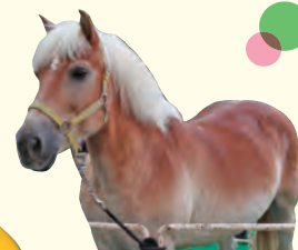
◎ポニーとのふれあい ブラッシングや 乗馬体験を行います。