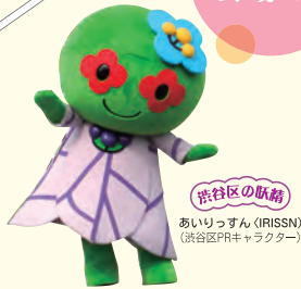
渋谷区の妖精 あいりっすん (RISSN) (渋谷区PRキャラクター)