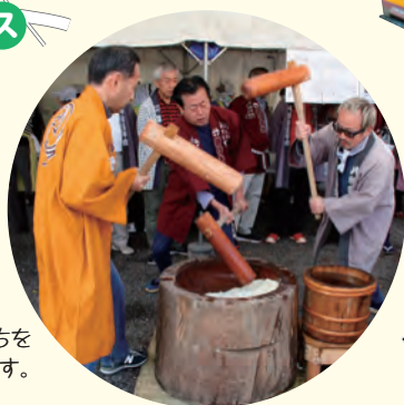
◎もちつき つぎたてのおもちを 無料で配布します。