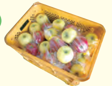
◎信州りんごの無料配布 長野県飯田市のりんご 2個1組を差し上げます。 (1家族につき1組まで。 数に限りがあります。)