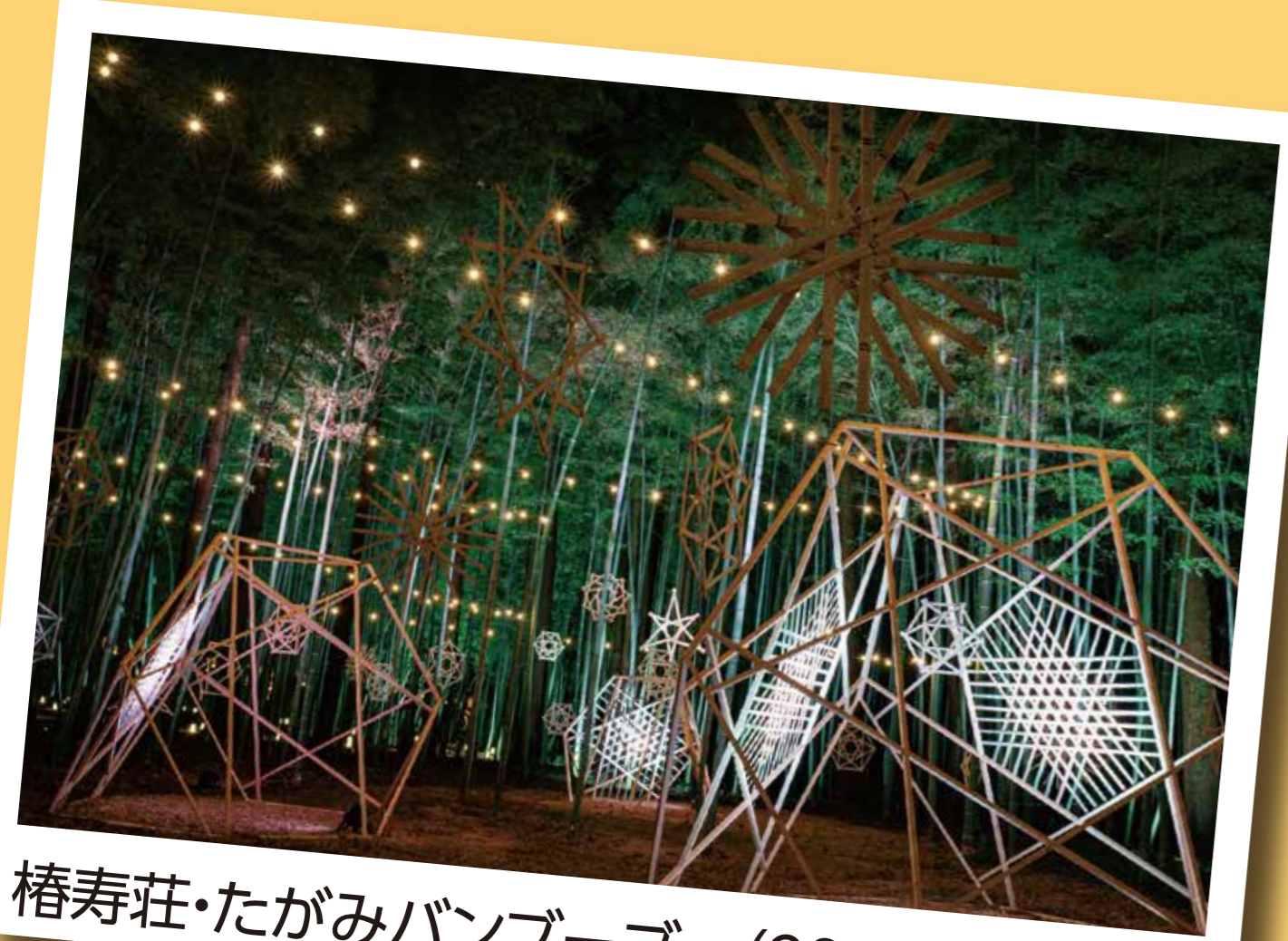
椿寿荘・たがみバンブーブー(2023)