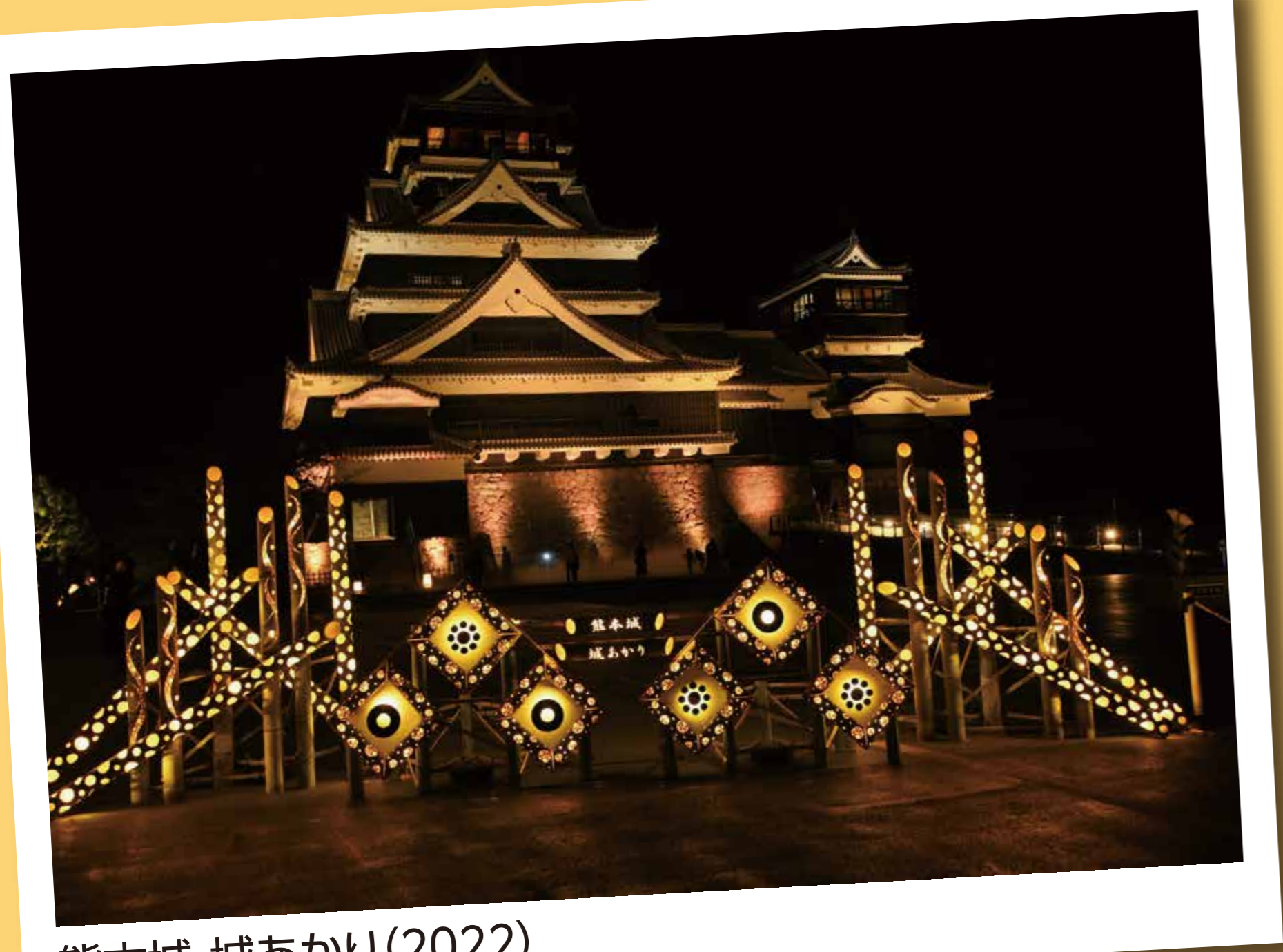
熊本城・城あかり(2022)

今回展示している竹あかりは新宿区と文京区の絆をつないだものを、熊本県のご協力により展示しています。