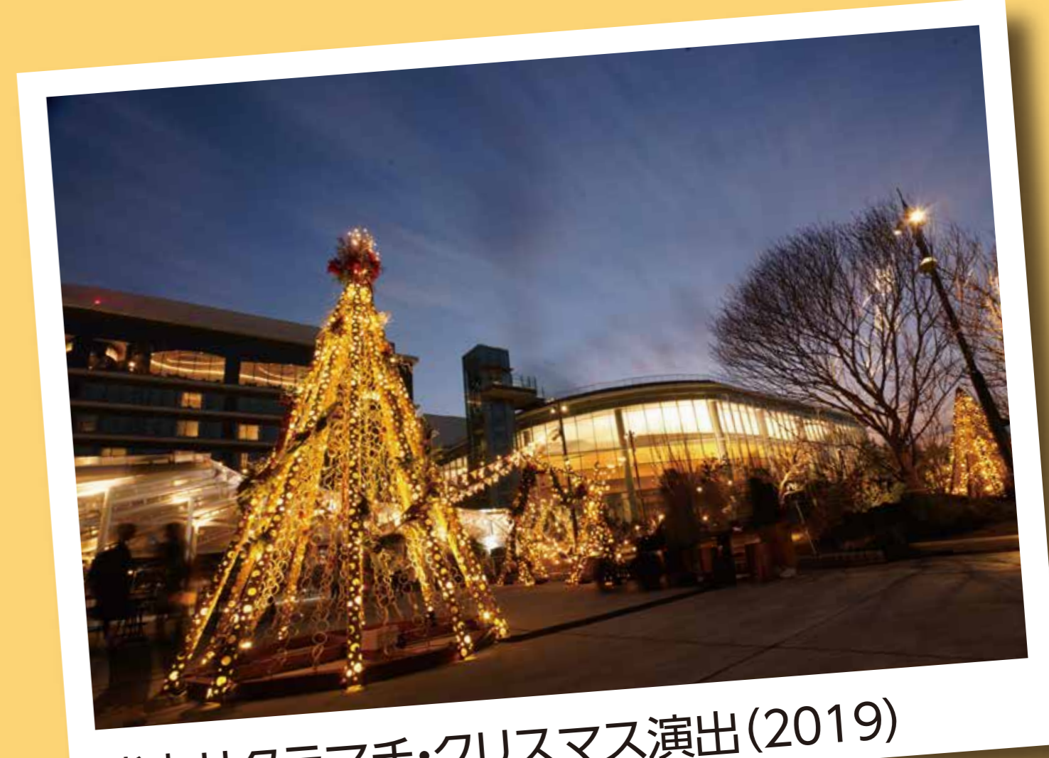
熊本サクラマチ・クリスマス演出(2019)