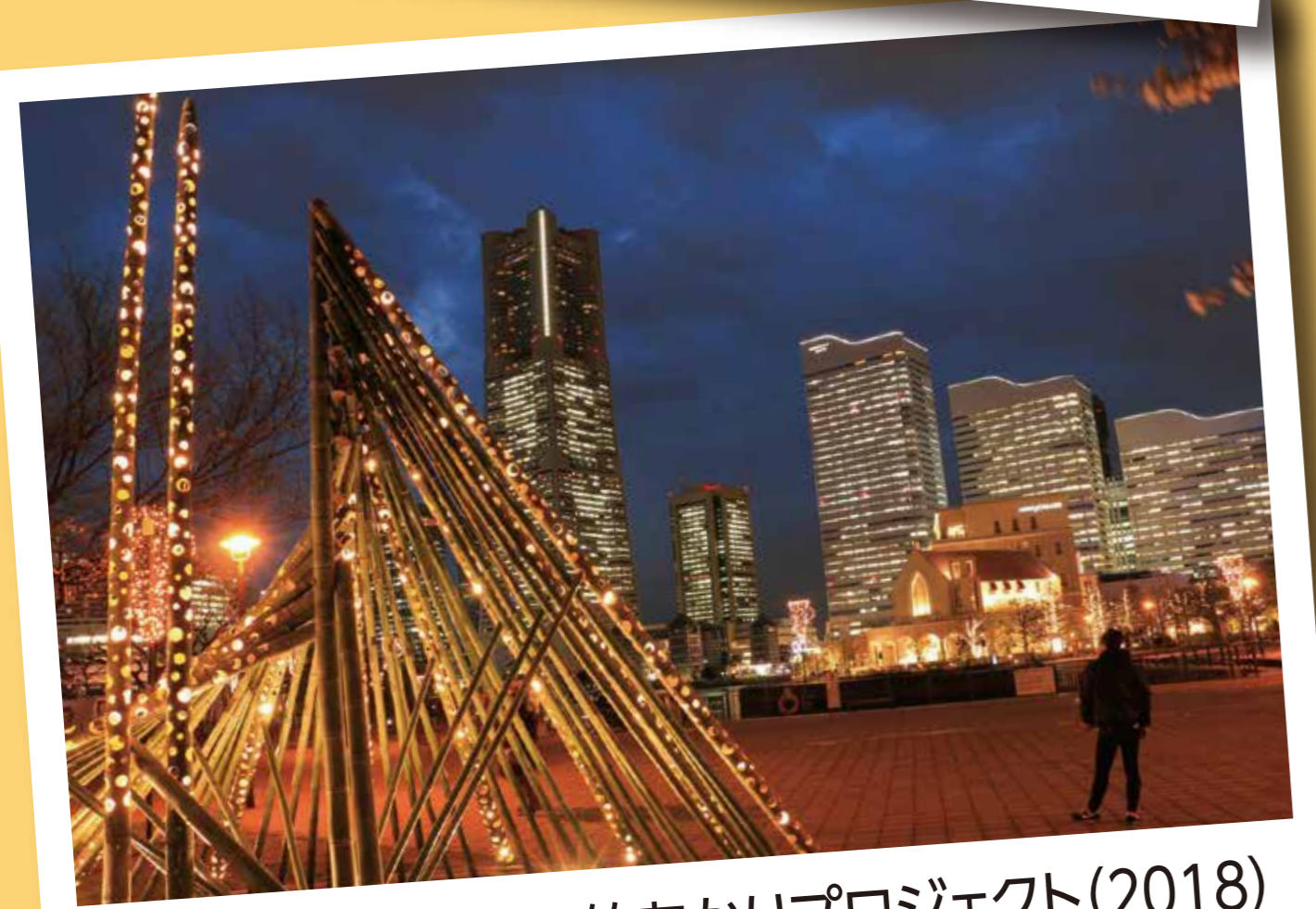
神奈川みなとみらい・竹あかりプロジェクト(2018)