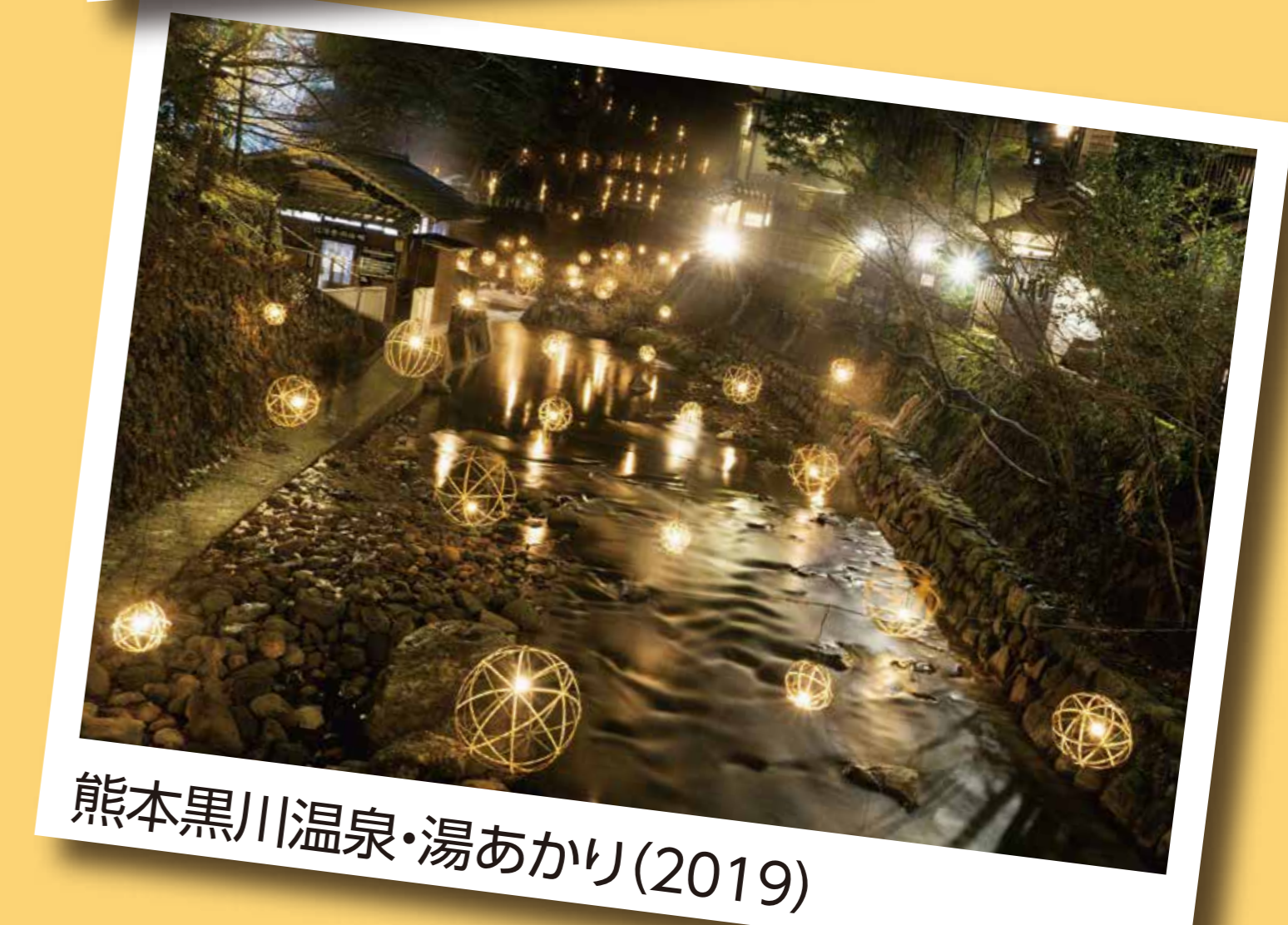
熊本黒川温泉・湯あかり(2019)