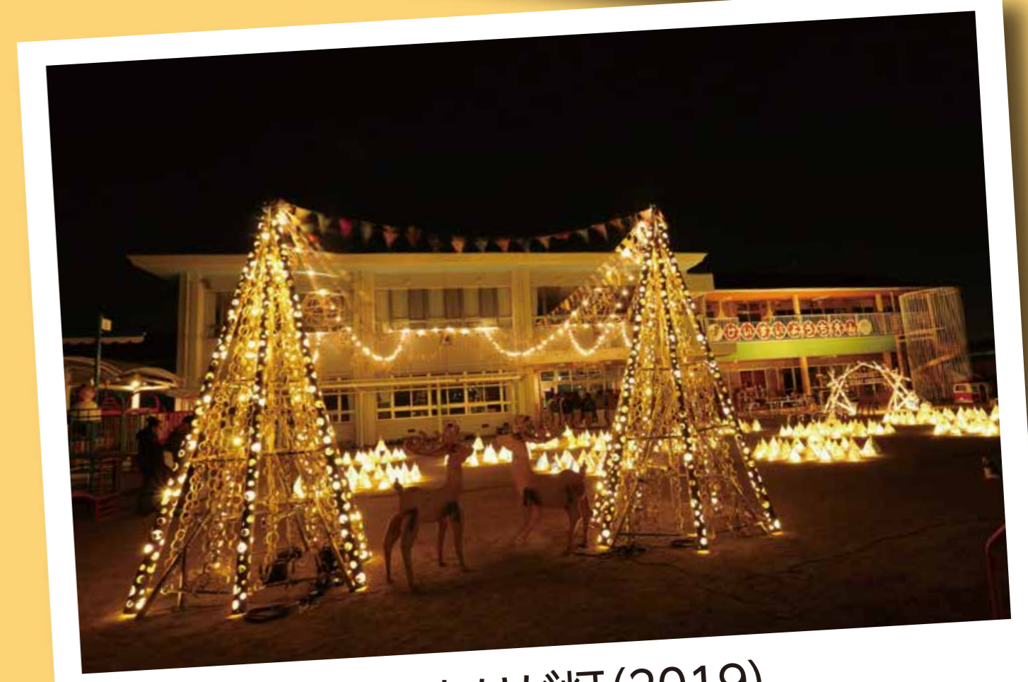
熊本恵水幼稚園・ありが灯(2019)