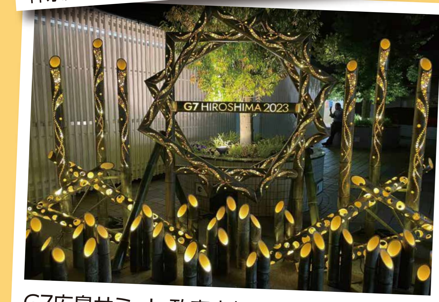
G7広島サミット 政府広報展示ブース(2023)