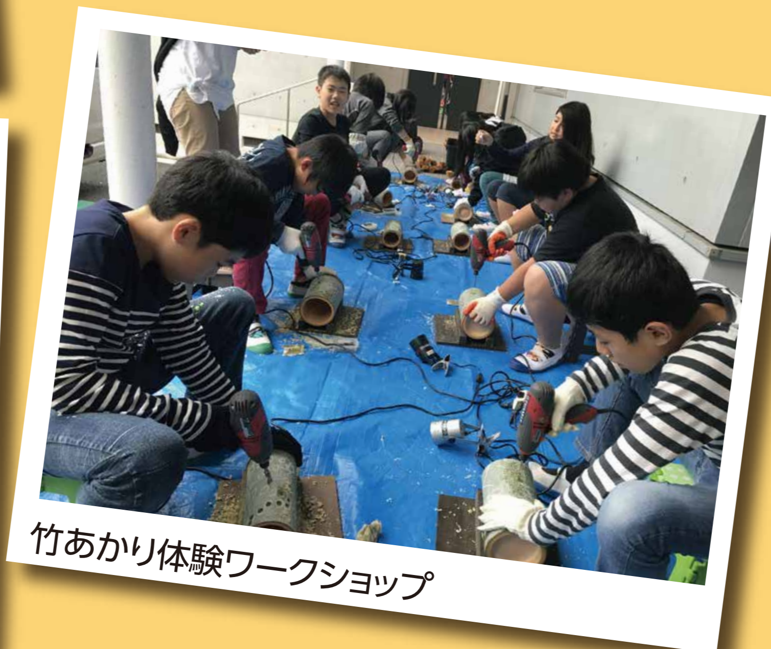
竹あかり体験ワークショップ