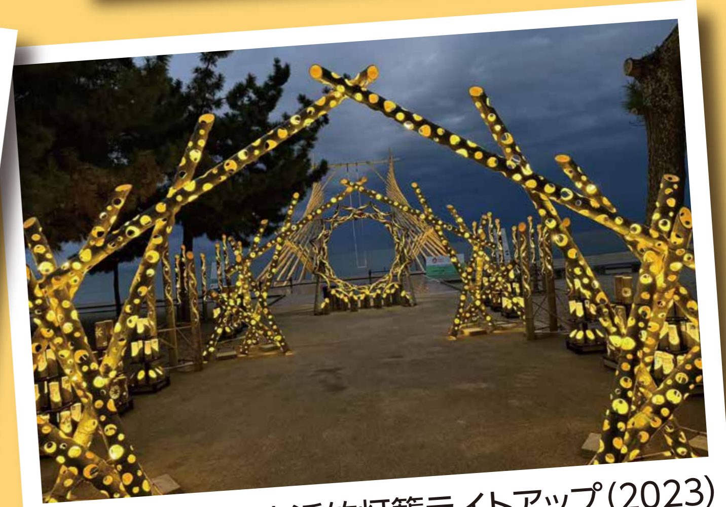
兵庫県淡路島・大浜竹灯籠ライトアップ(2023)