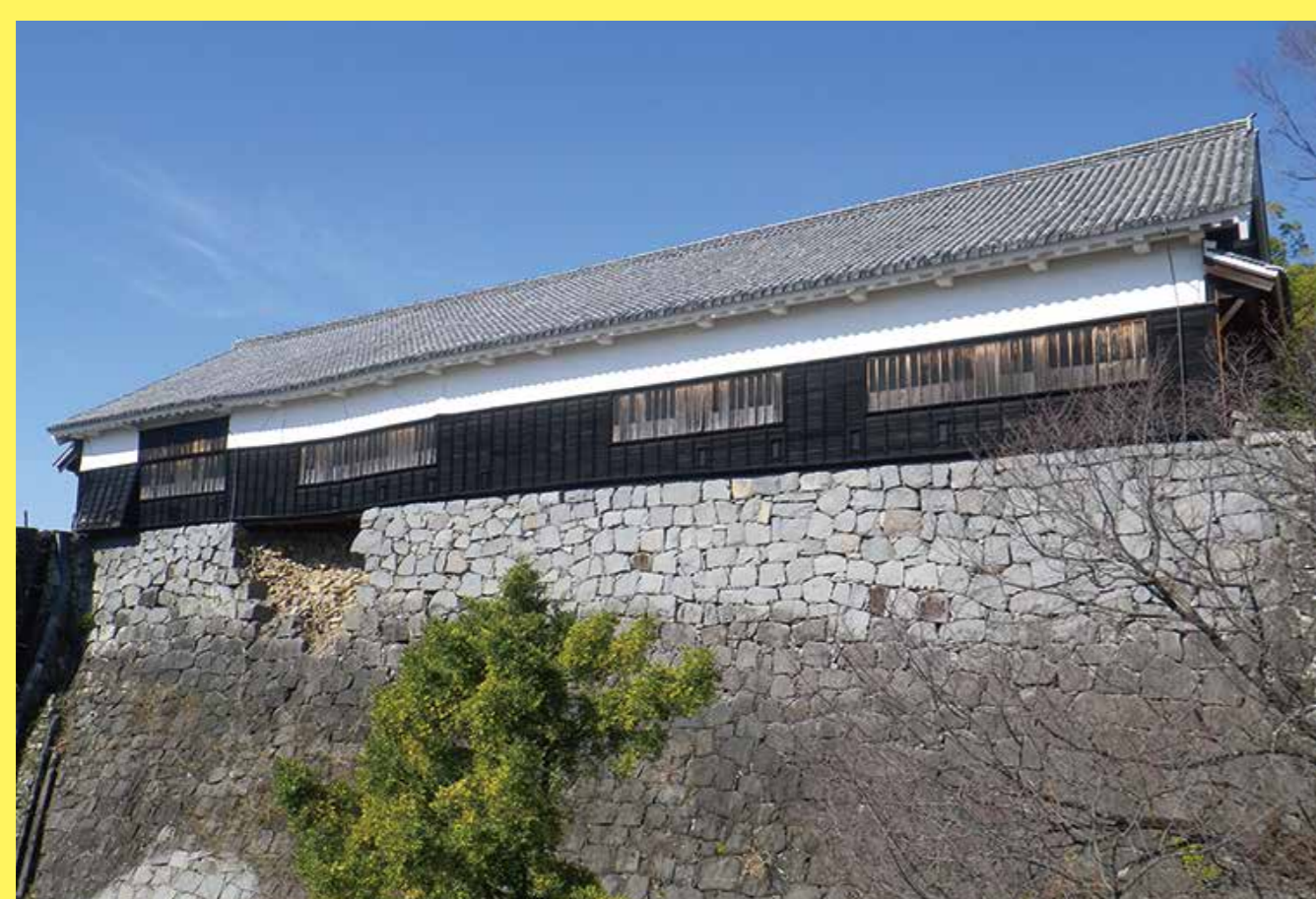
特別見学通路から見た数寄屋丸二階御広間