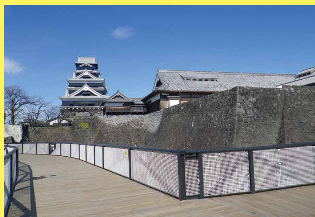
特別見学通路から見た天守閣