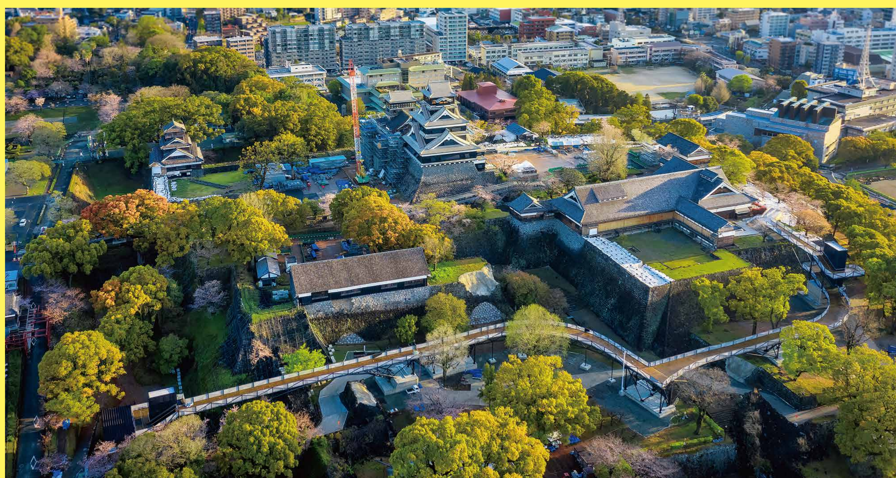
城内に設置された特別見学通路