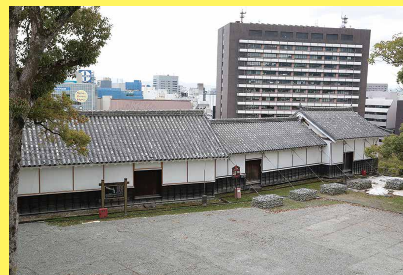
特別見学通路から見た東竹の丸重要文化財櫓群