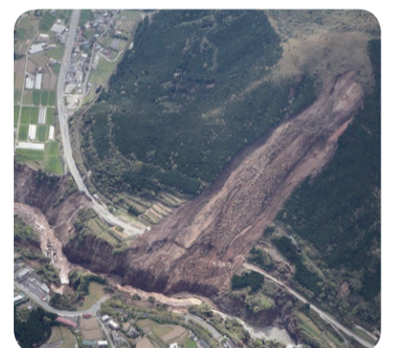
地震による大規模な土砂崩れ