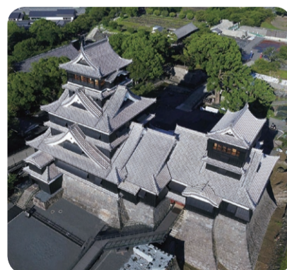
熊本城(2021年8月)