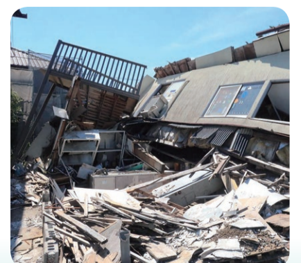
地震により倒壊した建物