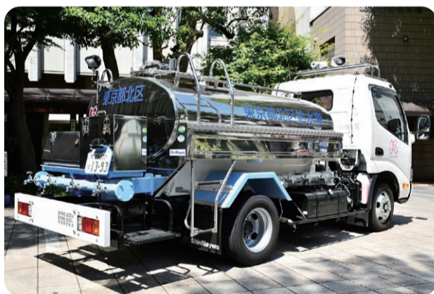
給水車による支援