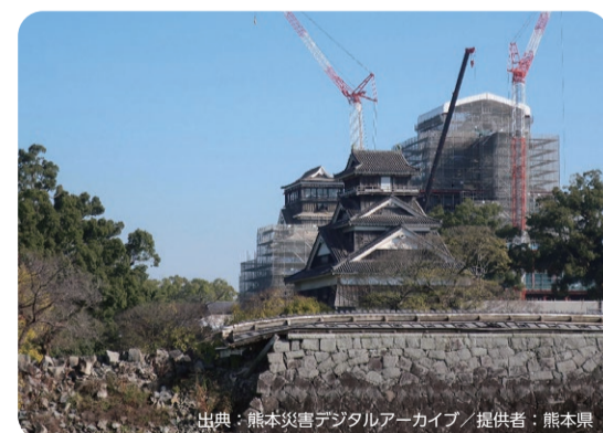
熊本城の復旧工事