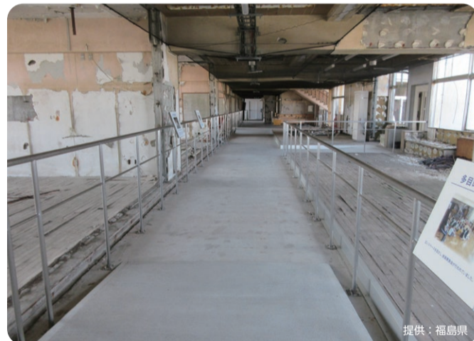
震災遺構・浪江町立請戸小学校