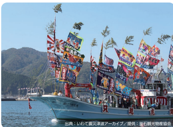
岩手県の釜石まつり