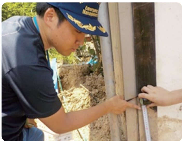
派遣した職員による被害状況の調査