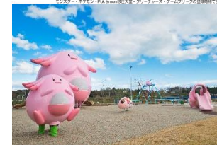
ラッキー公園 in なみえまち