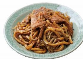
B1-ゴールドグランプリ なみえ焼そば