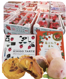
吉見いちごの加工品 (いちごミルクまん/いちごタルト)