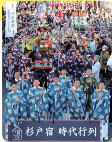
杉戸宿 時代行列 杉戸宿宿場まつり

江戸幕府が1616年に日光街道に設置した宿場です。杉戸宿は、江戸に近い方から新町、下町、中町、上町、河原組、横町から構成されていました。更には南端に清地村、北端に九軒茶屋(茶屋組)があり、宿場と連続した町場を形成していました。