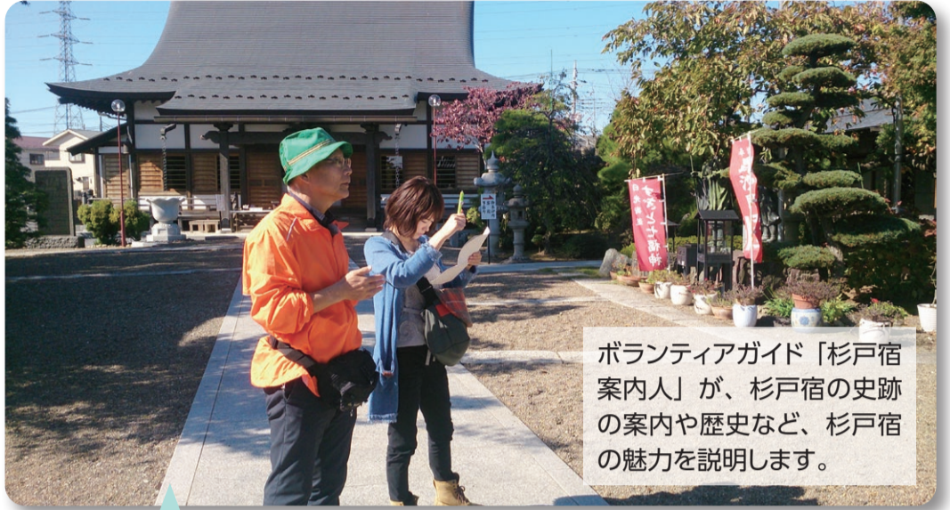
ボランティアガイド「杉戸宿案内人」が、杉戸宿の史跡の案内や歴史など、杉戸宿の魅力の説明します。