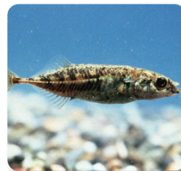
県の魚 「ムサシトミヨ」