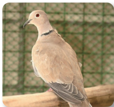
県民の鳥 「シラコバト」

埼玉県には、自然がいっぱい。動物や植物が元気よく育っています。県では、わたしたちに身近で親しみのある鳥や木、花、蝶、魚を県のシンボルとして指定しています。