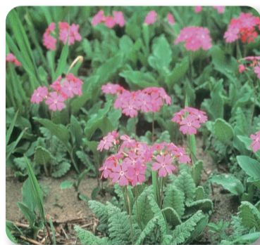
県の花 「サクラソウ」