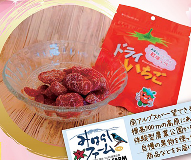
みはらしファーム MIHARASHI FARM

※イラストや画像はイメージです。 ※内容が一部変更となる可能性がございます。 ※商品の数には限りがあります。