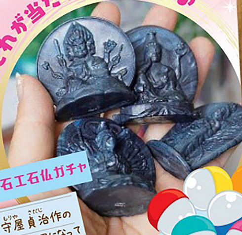
高遠石工石仏ガチャ